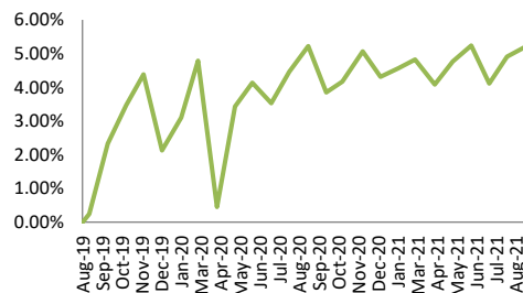
— Proteksi Gebyar 2